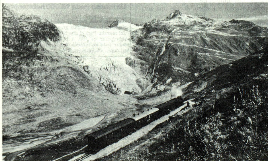
Foto histórica tomada delante del glaciar del Ródano, sobre la línea de la Furka, actualmente desahogada.

su especialidad -filet en croute- en la pequeña cantina de un metro y medio del coche restaurant 3814 (modelo 1928) de los RhB. «Para mi es un placer y un cambio en la esfera profesional» explica. Los tres mozos llevan a cabo verdaderas proezas de acrobacia para llevar platos y bebidas hasta las mesas, sin perder el equilibrio sobre un piso vacilante y traqueteante. El aumento de la demanda es ciertamente muy satisfactorio, pero plantea problemas casi insolubles a tres ferrocarriles. El expreso de los glaciares debe así cubrir el trayecto cuatro veces por día en cada dirección. Además, sobre los ramales escarpados provistos de cremallera, las locomotoras pueden tirar de seis vagones como máximo, incluido el coche comedor, y deben efectuar maniobras muy complicadas.