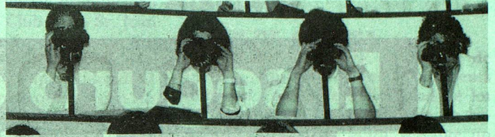
No solamente los futuros médicos deberían mirar de más cerca... (Estudiantes en el anfiteatro de patología de la Universidad de Berna).

Escuelas privadas en Suiza , lista de escuelas que forman