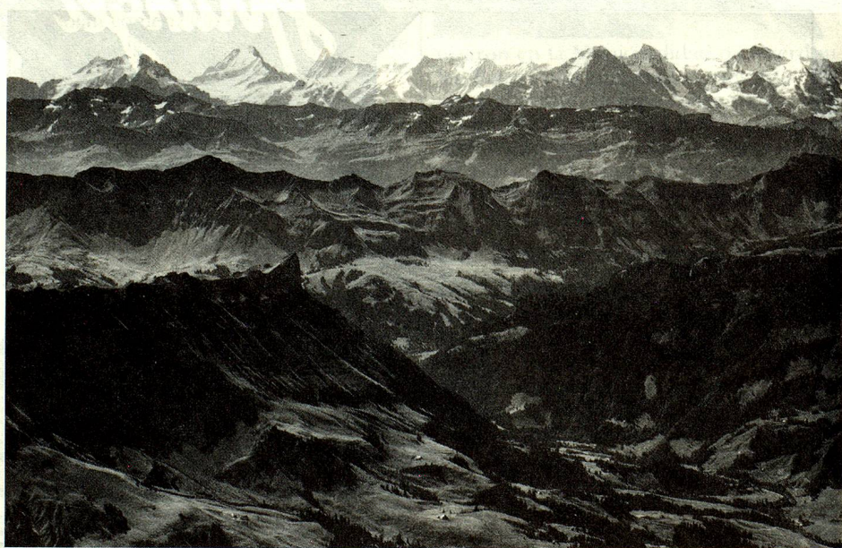
Las montañas suizas: una mayor atracción para el público. Esta vista aérea muestra las cadenas de montañas de los Prealpes y de los Alpes berneses. Arriba a la derecha, se ve el Eiger, el Mönch y el Jungfrau.

Gracias a ellos, la región del Gothard se volvió rica pero dependiente. En Suiza, una persona en actividad sobre diez vive del turismo; en las regiones de montaña, que representan por cierto las dos terceras partes de nuestro país, hay mismo