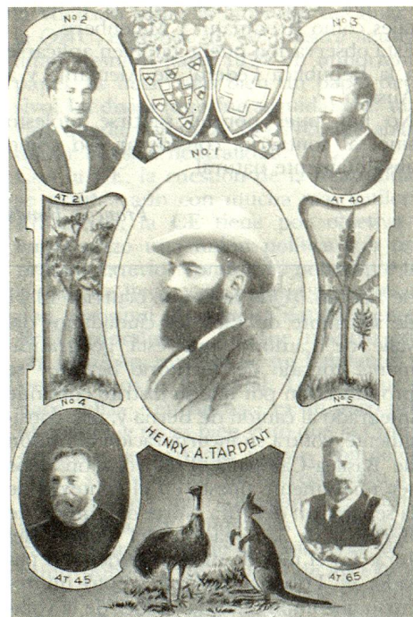
Henri Tardent, que vivió en Queensland, es ciertamente entre los suizos de Australia quien dejó más huellas. La influencia de este ciudadano de Vaud, que participó en la elaboración de la primera constitución australiana, se hace sentir todavía hoy en la vida política del Quinto Continente.

No es solamente en los negocios de comestibles donde se encuentran productos «suizos». En Australia, como sin duda en todas partes, los padres se sienten con frecuencia desilusionados al ver el poco interés que manifiestan sus hijos por la cultura suiza. Pueden consolarse con la idea que, a menudo, la tercera, cuarta o quinta generación se siente de nuevo arraigada a la patria de sus antepasados. Igualmente, parece que algunos trazos de carácter así como el aspecto específicamente suizo se transmiten de generación en generación. Es fácil imaginarse la sorpresa de ese australiano venido a Suiza para hacer averiguaciones sobre su familia y que no conocía ninguno de nuestros idiomas nacionales, cuando, en el curso de su primera visita a la ciudad de origen