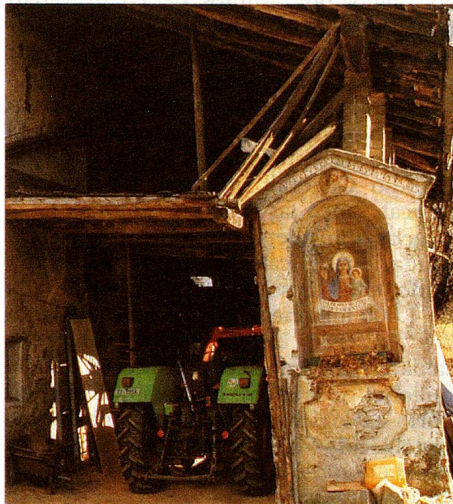
La agricultura tesinesa ha pasado actualmente a ser marginal.

Con respecto a las ideas y a las buenas intenciones, el cantón del Tesino es un alumno modelo en materia de aprovechamiento del territorio. El Consejo de Estado del Tesino no se limitó a elaborar el plan directivo cantonal prescripto por la Confederación, como lo hicieron muchos cantones. En el Tesino, el plan directivo —que precisa donde se tiene el derecho de construir y donde la agricultura debe quedar intacta— está retenido por el Parlamento. El derecho de partici-