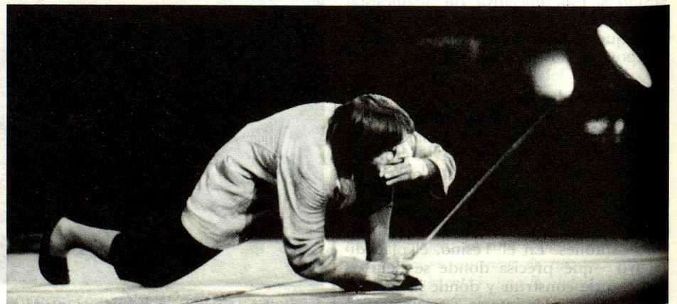
Es escena, el mismo Dimitri, célebre en el mundo entero.

¿Es que la imagen del cantón más meridional de Suiza estaría pues cambiando? Desde hace algunos años, intelectuales y autoridades tratan de restituir al Tesino una identidad que, para algunos, está ya perdida y, para otros, nunca existió. Más allá de esas divergencias de opinión una cosa es, en todo caso, cierta: existe la voluntad de cambiar esa imagen, lo que se manifiesta bajo diferentes formas. En el curso de los últimos cinco años esa voluntad de salir de cierto aislamiento cultural se distinguió ante todo por una gran actividad en la esfera de las exposiciones.