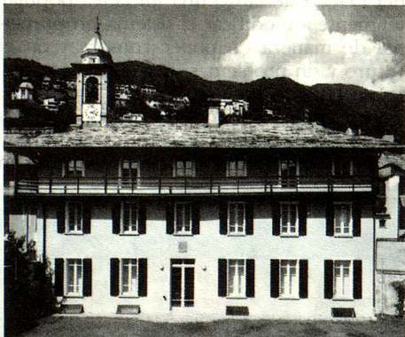
La Casa Rusca en Locarno alberga la colección de obras de arte de la ciudad de Locarno así como la colección Hans Arp.

Si se trata de interpelar a un turista en la calle preguntándole porqué le gusta el Tesino, ya sea en el paseo al borde del lago en Lugano, bajo las arcadas de Locarno o en los senderos que dominan los