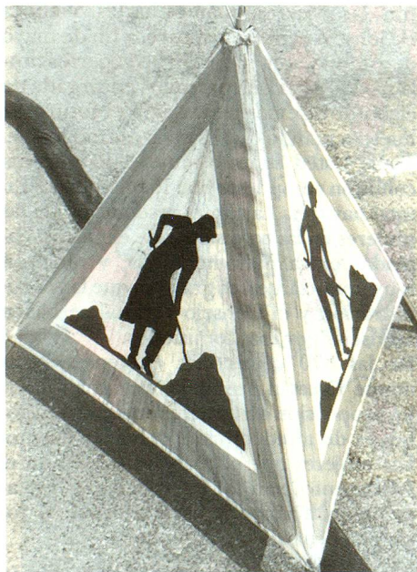
A trabajo igual, salario no siempre igual.

Judith Stamm, que desde principio de año es presidente de la Comisión Federal para las cuestiones femeninas, es Consejera Nacional lucernense desde 1983 y miembro del partido demócrata cristiano (PDC). De 1971 a 1984 ocupó un escaño en el Gran Consejo del cantón de Lucerna. Nacida en 1934, Judith Stamm pasó su juventud en Zurich, donde terminó sus estudios de derecho con un doctorado. Durante varios años trabajó en la Policía cantonal de Lucerna siendo la primera mujer de Suiza nombrada oficial de policía. Actualmente es juez de menores.