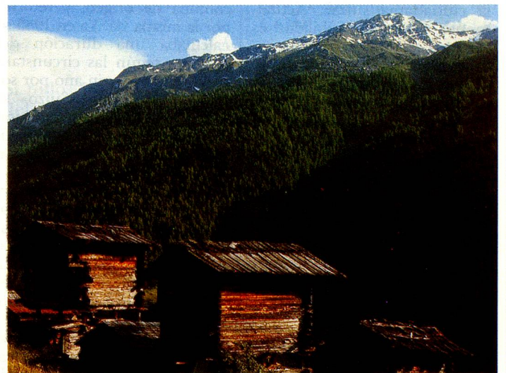
Valle de Anniviers