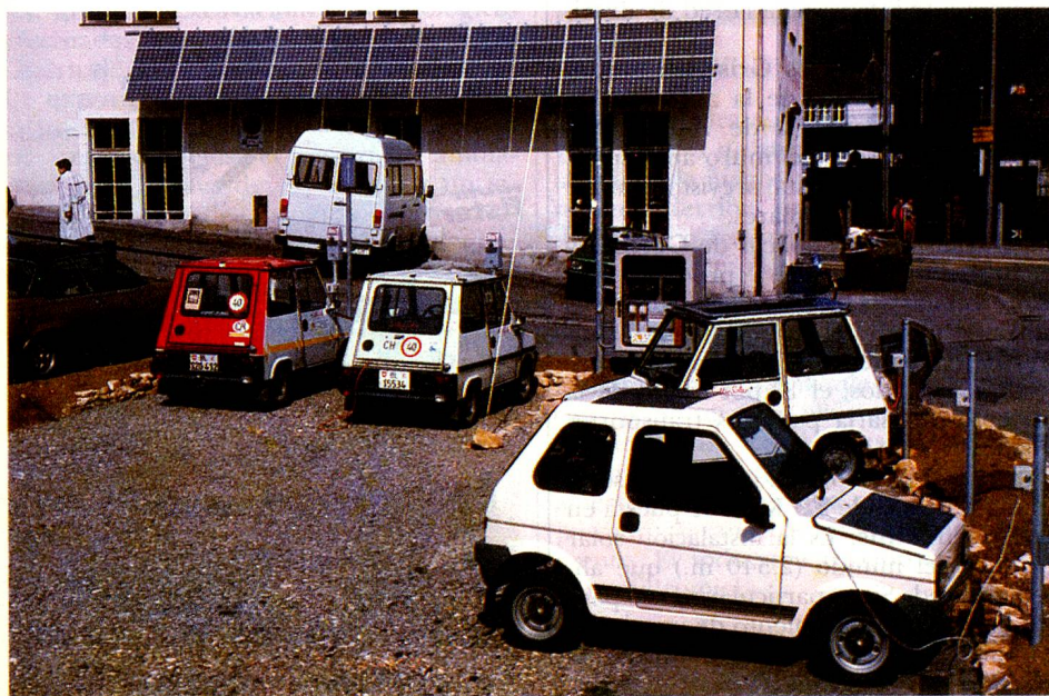
Los automóviles eléctricos cargan «sol» en Liestal.

«Actualmente la situación es casi inversa: