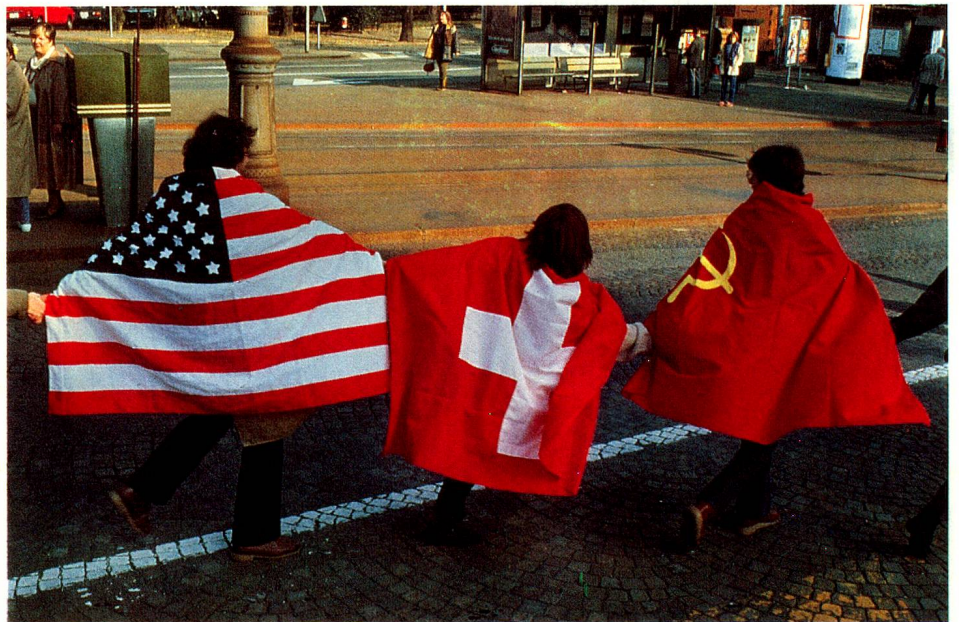
Este y Oeste se dan la mano.

Van desde la escuela primaria hasta las atracciones de una discoteca –prohibidas como consecuencia– pasando por la «escuela de hombres» (servicio militar). Los contrastes se suceden: después de la muerte, un tabú, es el baile de los oficiales, luego se ven los albergues donde están alojados los solicitantes de asilo e, inmediatamente después, niños jugando y niños enfermos. Bajo el título ambiguo de «El clima de Suiza» se encuentran, codo con codo, fotos que muestran una computadora en un establo y un desfile de modas, una fogata del 1º de agosto y la Feria de la Cebolla en Berna, así como una foto particularmente lograda de un coche tirado por caballos obligado a frenar bruscamente para dejar paso a un ve-