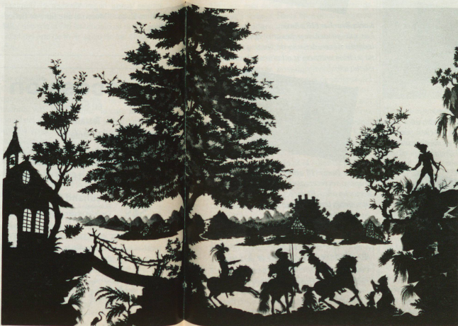
El elegante arte del recorte de siluetas no se arredra ante la eminente temática de Guillermo Tell. Esta medio dramática, medio idílica representación de la muerte de Gessler data del siglo XIX.