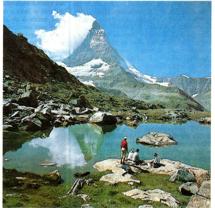
El Monte Cerviño como telón de fondo es nuestra mejor tarjeta de presentación

puede en muchos lugares ser mantenida más que por el hecho que el turismo procura al campesino una entrada complementaria. El futuro del turismo y la suerte de la agricultura de montaña esta-