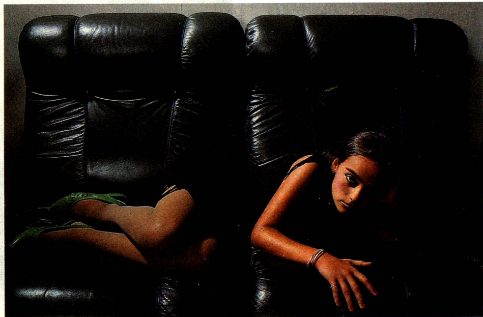
... y de la moda.

La violencia como expresión de la incapacidad de adaptación a la época actual se encuentra en las bandas de chicos y muchachos de Zurich. Los ataques a mano armada, las heridas con cuchillo y las tentativas de violación son moneda corriente. Los autores son jóvenes. ¿Es que los jóvenes suizos no tienen nuevos valores que defender que sean propios? En base a un sondeo efectuado después de la votación sobre la iniciativa solicitando la supresión del ejército, el Grupo para una Suiza sin Ejército piensa poder constatar un cambio en la escala de valores: 60 por ciento de los votantes entre 20 y 30 años estaba a favor de la iniciativa.