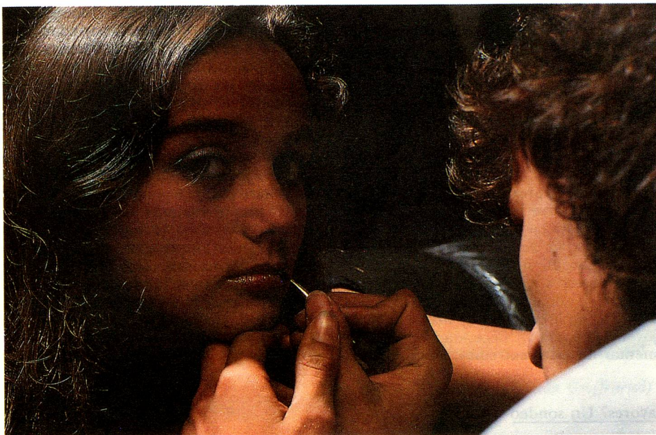
... y sin embargo ya en pleno culto de la belleza...

nes y pagaron 110.- francos por la entrada. La juventud suiza no se priva de nada en este año aniversario y, al mismo tiempo, llena los bolsillos de los organizadores que, por ejemplo en Frauenfeld, obtuvieron un beneficio de unos tres millones de francos.