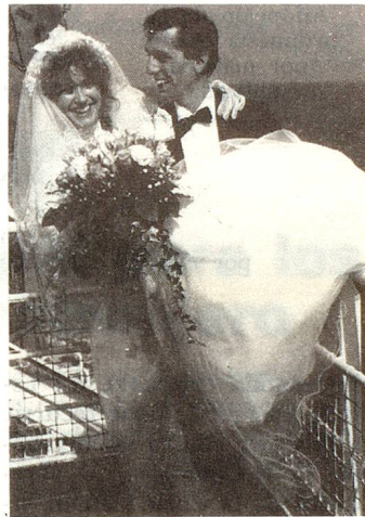
Para una extranjera, desposar un suizo no la hará acceder automáticamente a la nacionalidad suiza.

Contrariamente a lo establecido por las disposiciones anteriores, una suiza del extranjero que contrae matrimonio con un extranjero no pierde la nacionalidad suiza. Desde el 1º de Enero del próximo año,