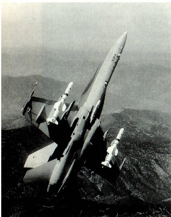
Sigue abierta la cuestión de que si los «Hornet» volarán alguna vez con insignias suizas.

Sea como fuere la Europa del año 2000, con o sin la adhesión de Suiza a la CE, la cuestión del transporte y circulación será de prioritaria importancia. El autor demuestra que si Suiza no quiere ser proscrita por el obstáculo que crea al desarrollo del transporte entre los países