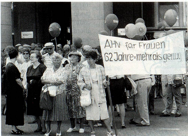
El Bundesplatz en Berna: demostración contra el aumento de la edad de jubilación de las mujeres.

(hasta el 21.8.96) Reto Wiesli, Postfach 22, CH-3000 Bern 15