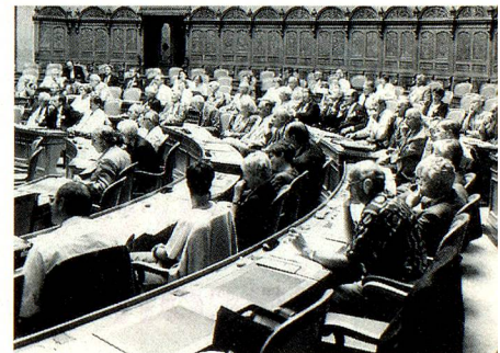
La sesión del Consejo de los Suizos del Extranjero celebrada en la sala del Consejo Nacional fue muy visitada.

En 1993, se habían llevado a cabo elecciones generales de los miembros del CSE, de tal modo que en la sesión de otoño de 1995 se cumplió con la mitad del periodo 1993 a 97. El director del gremio, Jean-Jacques Cevey, consejero nacional retirado, aprovechó esta oportunidad para presentar un balance de medio tiempo. Mencionó los éxitos más importantes (haber salvado dos veces el AVS/AI voluntario y haber logrado que no se cortaran las subvenciones para los colegios suizos en el extranjero), así como los dossiers «abiertos» (mejorar la información, reconocimiento de los diplomas, reestructuración de los servicios diplomáticos y consulares, reglamentación definitiva del AVS/AI voluntario). En suma Cevey se mostró satisfecho con lo que se había alcanzado hasta el momento.