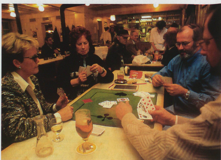
Los jugadores de Jass «interculturales»: una velada amena con profundos conocimientos sobre la convivencia amigable en Suiza.

sobre las reglas antes de empezar. Mientras que la rueda semanal de Jass en el restaurante del pueblo no requiere reglas especiales, al jugar con personas de «otra cultura» esto se vuelve imperativo.