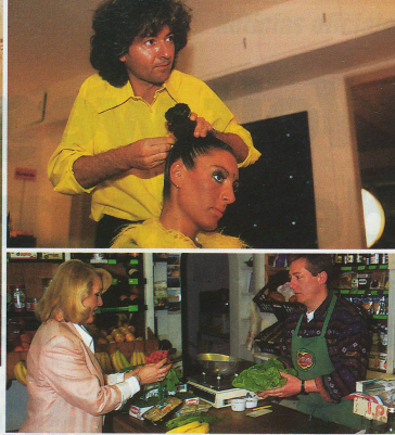
Las empresas pequeñas y medianas son la base de la economía suiza tanto en la industria como en el campo de los servicios.