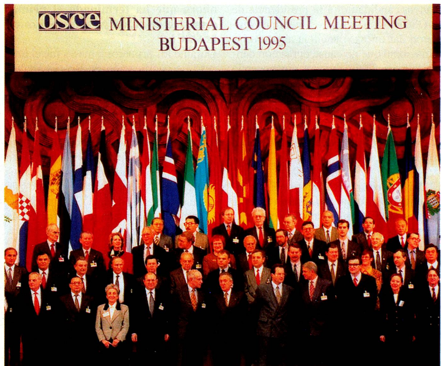
En la conferencia de ministros de la OSCE llevada a cabo en Budapest, Hungría, el pasado diciembre, se inició la presidencia de Suiza.

La responsabilidad general por la implementación de los objetivos de la OSCE (dirección de las operaciones de diplomacia preventiva, tomar la iniciativa en casos de crisis y/o cuando se violan las reglas de la OSCE y el presidio de los diferentes órganos) este año le corresponde a Suiza con el apoyo de Hungría y Dinamarca. La realización