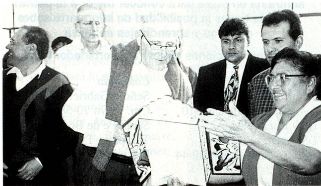
El Ministro de Relaciones Exteriores de Suiza señor Flavio Cotti visitando las instalaciones de la panadería "El Buen Pastor", uno de los proyectos financiados por el Fondo de Contravalor Perú-Suiza

En Ventanilla, Dentro del marco de las actividades llevadas a cabo por el Fondo de Contravalor Perú-Suiza