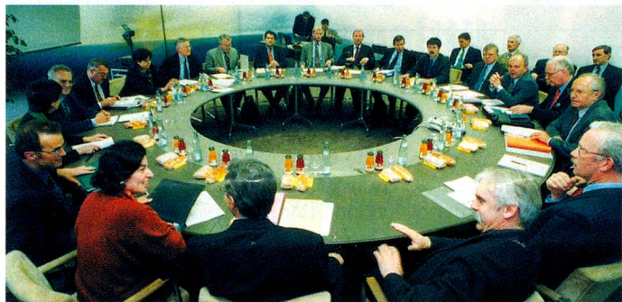
Die Gespräche am Runden Tisch haben zur langfristigen Sanierung der Bundesfinanzen beigetragen.

Otro tema electoral controvertido debería ser la política fiscal. Paul Rech-