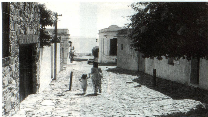
Ciudad de Colonia, Uruguay. Vista de una de las calles que desemboca en las costas de la ciudad.

La ciudad uruguaya de Nueva Helvecia, situada en el departamento rural de Colonia, fue fundada por inmigrantes en su mayoría suizos cuyo primer contingente llegó el 21 de noviembre de 1861. Estos pioneros se instalaron sobre tierras adquiridas previamente en 1858 por el bernés Carlos Cunier y, en el transcurso de los años, fueron seguidos por otros helvecios en busca de una nueva vida en el Uruguay dando así nacimiento a una ciudad próspera, Nueva Helvecia, que cuenta actualmente con 7500 habitantes. Si bien esta región supo conservar con cuidado su carácter suizo, especialmente en ocasión de festejar en familia y entre amigos la Fiesta Nacional Suiza, es recién el 1° de agosto de 1928, por iniciativa del señor Juan J. Greising, que se funda una primera Comisión (Comité de Festejos del 1° de Agosto) con el objeto de dar a esa manifestación patriótica un carácter más oficial y comunitario. El 17 de julio de 1970, la mencionada Comisión fue reestructurada y se convirtió en la Comisión Pro Colonia Suiza "Trabajo y Tradición", que extendió su actividad a otros