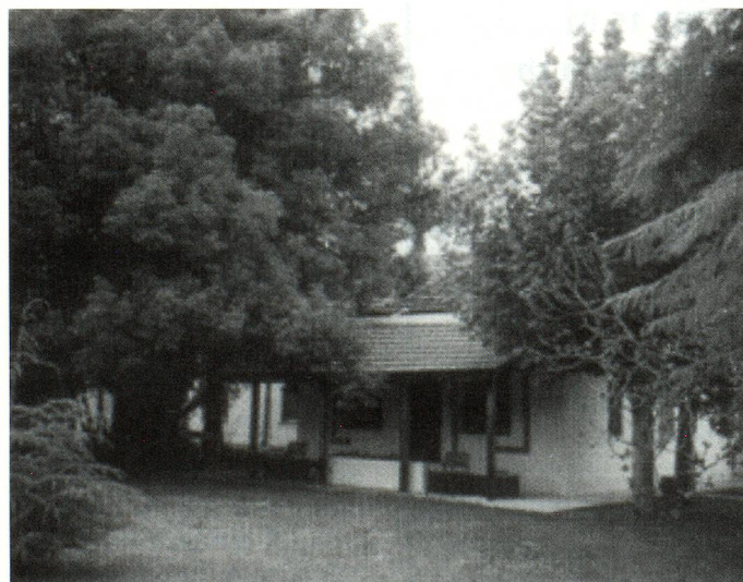
Vista posterior del hogar, ubicado en la localidad de Villa Ballester