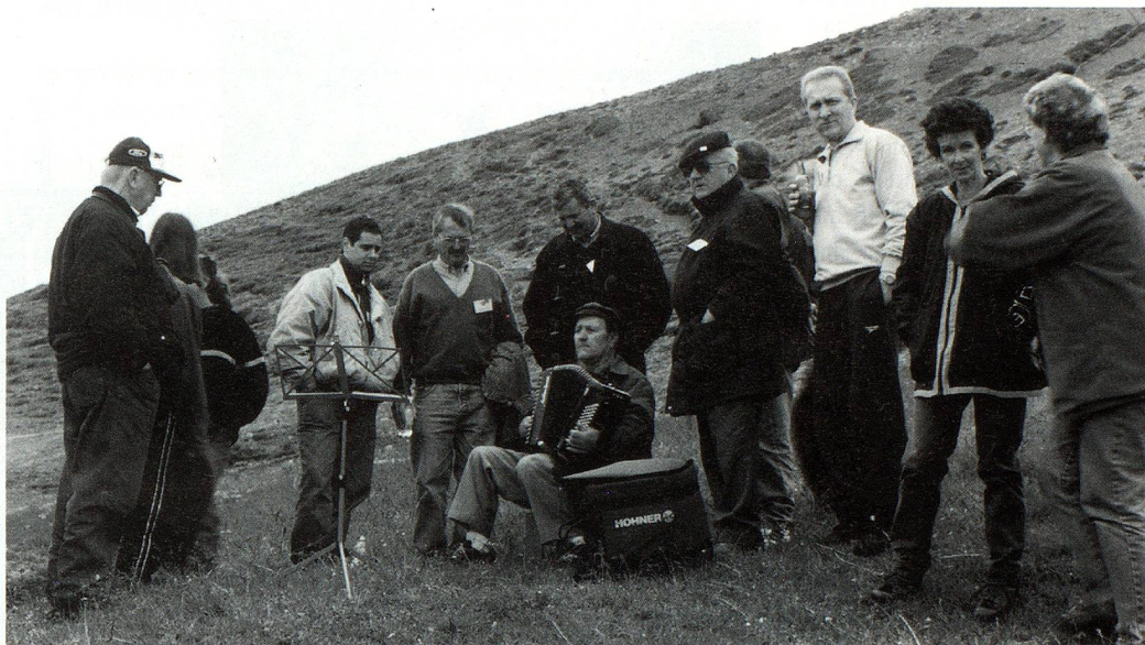
Integrantes de Zillertal, junto a turistas argentinos y anfitriones de Suiza en Grengiols.

El programa incluyó una participación especial en el pueblo valesano de Grengiols, en el que se llevó a cabo una celebración con motivo de los 200 años de la reconstrucción de la localidad. La