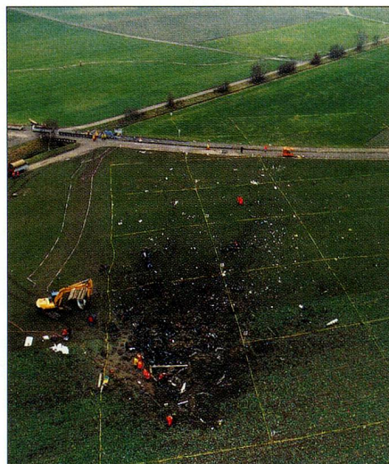
El avión Saab 340 de Crossair se estrelló cerca de Niederhasli, ZH poco después de despegar.

EN NIEDERHASLI , cerca de Kloten, se estrelló un avión de Saab de la empresa Crossair. El aeroplano cayó a tierra en un campo arado y se incendió inmediatamente después de haber despegado. Fallecieron todas las 10 personas (7 pasajeros y 3 miembros de la tripulación) que iban en él destino a Dresden, Alemania. El capitán era de Moldavia y el copiloto de Eslovaquia. Aún están indagando sobre las causas de la tragedia. Esta fue la primera vez que se estrelló un avión de Crossair, inaugurada hace 21 años y miembro del Grupo SAir.