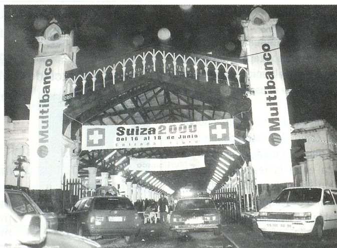
Vista panorámica de los galpones de la estación.

En el stand de la Embajada, los interesados han podido recibir informaciones y documentación sobre nuestro país. Por su parte, la ONG Suiza Helvetas han hecho conocer sus proyectos de cooperación en el Paraguay.