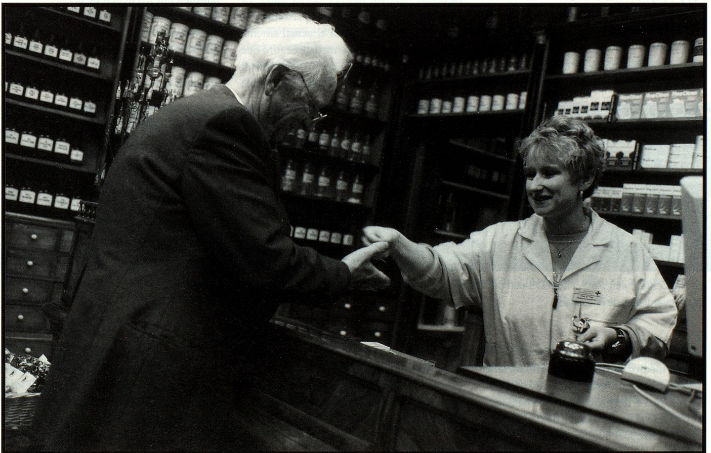
A partir de mediados del año, los apotecarios también cobran por sus servicios de asesoramiento.