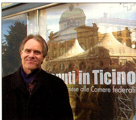
Leuenberger, presidente, federal, en Lugano.

Después de la sesión realizada en Ginebra en el año de 1993, los miembros de los Consejos Federales celebraron una «sesión fuera de casa» en Lugano del 5 al 23 de marzo.