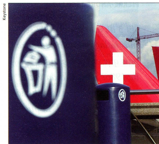
La debacle de Swissair sacudió la percepción propia de Suiza

La nueva ley sobre el seguro de enfermedad, lanzada en 1994, no logró cumplir con uno de los puntos prometidos originalmente: restringir los costos de la salud pública. Durante los últimos años las primas de los seguros de enfermedad aumentaron incesantemente. En el marco de la revisión presentada al Consejo de los Estados, los «senadores» han propuesto determinadas correcciones, tales como suprimir para las cajas de enfermedad la obligación de reconocer a todos los prestadores de servicios médicos. Esto podría significar para los pacientes una limitación de la libre selección de médicos y farmacias. Los consejeros de los estados aprobaron también la ley de equiparación de los discapacitados: dentro