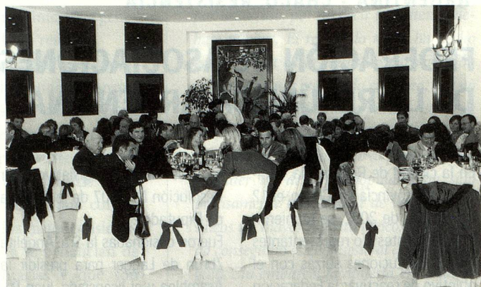
Salón Imperial de la Asociación Suiza "Guillermo Tell" de Esperanza

En sus modernas instalaciones, la Asociación Suiza "Guillermo Tell"- pionera entidad fundada el 16 de agosto de 1874- desarrolla actividades administrativas, sociales y culturales como clases de baile típico suizo para niños y adultos y