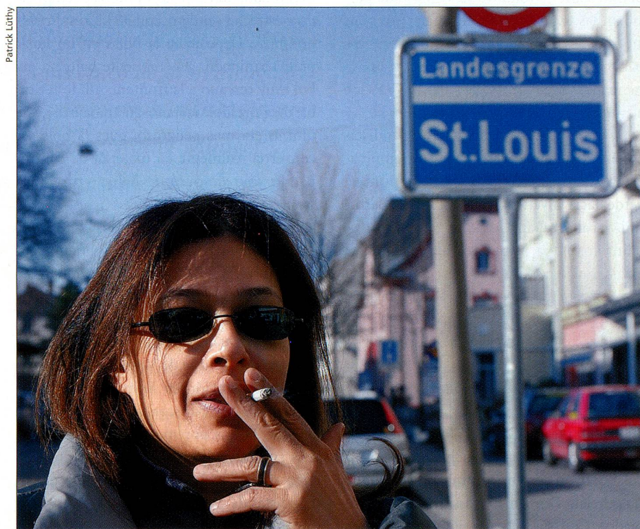
Por las grandes diferencias de precios, muchos franceses compran sus cigarrillos en Suiza.