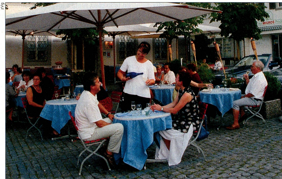
Demanda por buena cocina y servicio perfecto. Aquí, en el restaurante «Linde» de Stans (NW).

¿Busca ideas para una caminata en la región alta de Berna? ¿Desea recorrer Los Grisones en bicicleta? ¿Quiere vacaciones alpinas estivales o esquí en invierno? ¿Disfrutar el wellness, visitar un festival o un museo, recorrer una ciudad? ¿Prevé un fin de semana largo o ya está pensando en sus próximas vacaciones en la patria? Encontrará las respuestas en el sitio de Internet www.MySwitzerland.com de Turismo Suizo. El fácil y sencillo sistema le guía confortablemente a través de las informaciones y ofertas turísticas actuales y hasta incluye la contratación directa de un hotel, casa o apartamento. Desde cualquier lugar del extranjero. RR