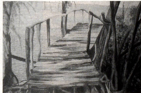
Luis César Bourband, “Muelle al río”