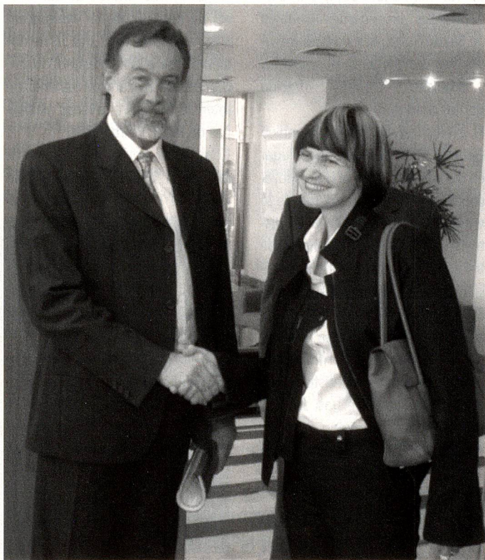
La Sra. Ministra con el Canciller Rafael Bielsa, en Bs. As.