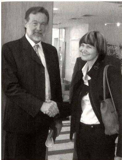
La Sra. Ministra con el Canciller Rafael Bielsa, en Bs. As.

han integrado con éxito en este país, al mismo tiempo siguen cultivando con amor y fidelidad las tradiciones y los valores suizos, les agradezco que mantengan viva esta herencia. Esta fidelidad los honra y hace de Uds. los mejores embajadores de Suiza en América Latina".