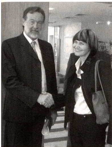
La Sra. Ministra con el Canciller Rafael Bielsa, en Bs. As.