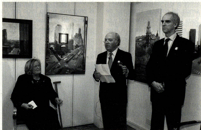
Presentación de la muestra de arte "Desde la Ventana"

La CCSA cita ya a todos sus miembros y a los suizos interesados en participar de un tercer evento, a principios de agosto de 2006.