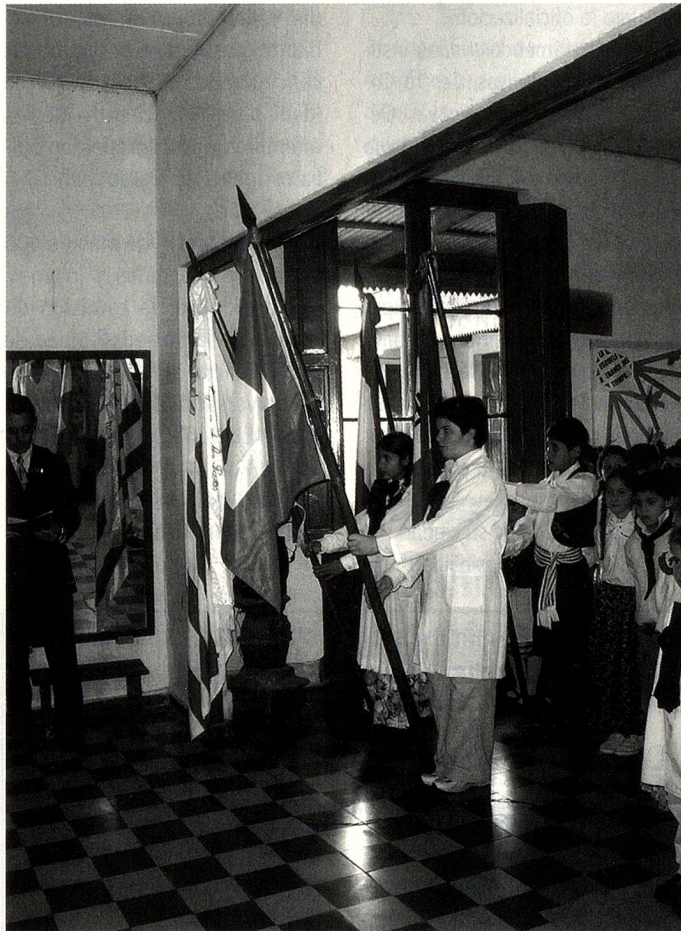
Acto en la Escuela Rural N° 20 "Suiza" en Laguna de los Patos

Distinta y muy emotiva fue la recordación que realizaron esa mañana del 1° de agosto, los niños de la Escuela Rural N° 20 "Suiza" de Laguna de Los Patos, próxima a Colonia del Sacramento, donde por primera vez ondearon juntas las banderas de Suiza y Argentina. Los asistentes cantaron ambos Himnos Nacionales, el Suizo, en italiano; realizaron una representación teatral sobre la