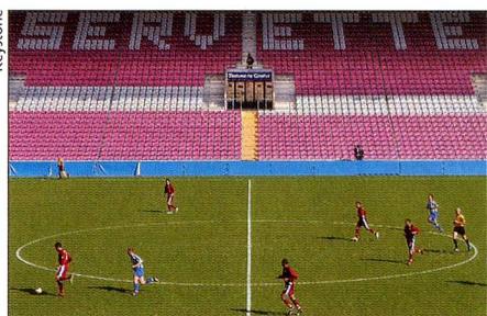
Quiebra del FC Servette de Ginebra.

17 de marzo. El ex-presidente del FC Servette, el francés Marc Roger, está detenido en prisión preventiva. Se le acusa de actuación fraudulenta en relación con la quiebra del club, que entró en vigor el 16 de febrero después de varios meses de proceso de apelación. La próxima temporada el equipo jugará en la 1ª Liga, mientras que la Súper Liga proseguirá con nueve equipos. En sus 115 años de historia este club nunca había ido al descenso. Entre sus palmas hay 17 títulos de campeón y siete victorias en la copa.