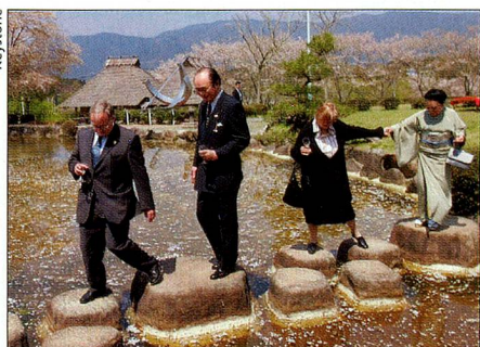
El presidente federal en la Exposición Mundial.

23 de marzo. Inauguración de la Exposición Mundial de Aichi, Japón. La Suiza cultural no se limita en absoluto al pabellón suizo en el «País del Sol Naciente». Pro Helvetia está organizando ya hace dos años un profuso programa en todo el país, destinado a presentar las actividades culturales con-