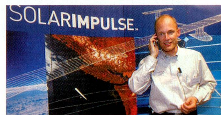
Bertrand Piccard quiere volar alrededor del mundo con energía solar.

18 Bertrand Piccard construye un avión solar