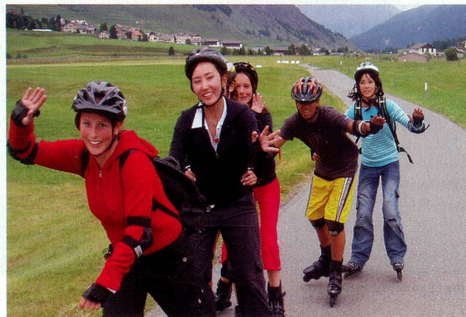
Inlineskate en y alrededor de La Punt, en la Engadina.

Algunos clientes asiduos se encuentran hace años en este campamento. Los nuevos son cordialmente bienvenidos. Una semana con mucho deporte de nieve en todas sus variaciones y contactos con suizos de todo el mundo.