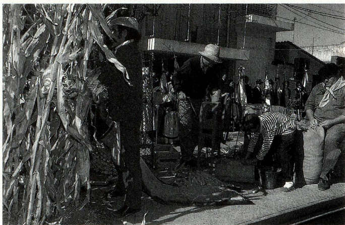
"Cosechando maíz", una de las carrozas evocativas

Desde hace mucho tiempo, el segundo domingo de junio de cada año congrega en la localidad a instituciones suizas de todo el país y de países vecinos, que llegan a ella con el fin de unirse a los festejos conmemorativos que tienen como objetivo "mantener y fortalecer la cultura suiza". El domingo por la mañana, se realiza un importante desfile evocativo del que participan también las delegaciones de instituciones suizas que se hacen presentes con sus coloridos trajes típicos, su alegre música y cuerpos de baile de niños y adultos. Después del almuerzo, los grupos de bailes y las orquestas típicas suizas alegran la tarde en la que todos los asistentes bailan hasta la noche.