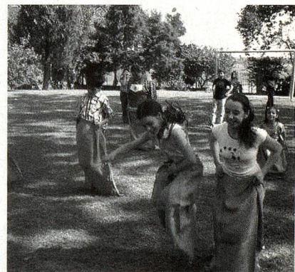
Los niños durante la carrera en bolsas