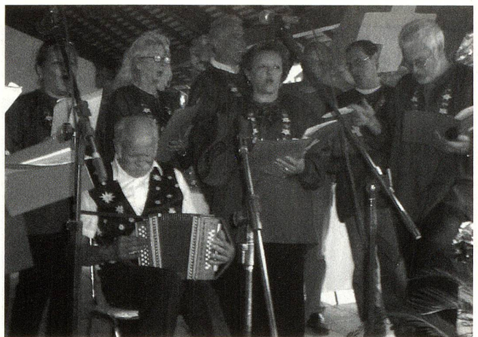
Actuación del Coro