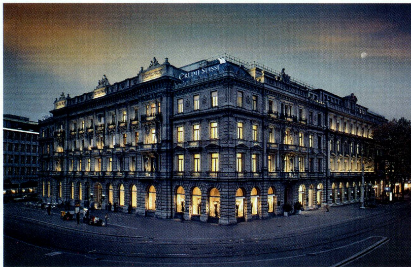
«Global Player» Credit Suisse: sede de Paradeplatz, Zúrich

El Banco Nacional Suizo registra estadísticamente las inversiones directas de la economía suiza en otros países (exportación de capital) y las inversiones extranjeras directas en Suiza (importación de capital). Según su definición, las inversiones directas ejercen una «influencia con-