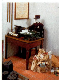
Museo de la Aduana, Gandria