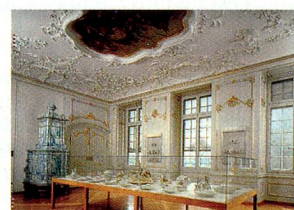
Zunfthaus zur Meisen, Zúrich