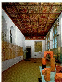
Museo Nacional, Zúrich