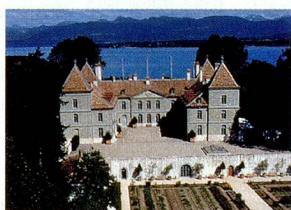
Castillo de Prangins