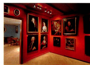
Museo Bäregasse, Zúrich