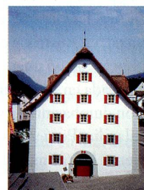
Foro de Historia de Suiza, Schwyz