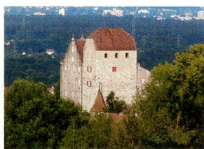
Castillo de Wildeg, cantón de Argovia

La Confederación Helvética no sólo subvenciona estas ocho instituciones del grupo Musée Suisse, sino que además posee un total de 15 museos. La Confederación apoya también a otros 70 museos de los que se encargan nada menos que cinco departamentos y once oficinas federales. Dado que no existe una política de museos propiamente dicha, el Consejo Federal ha recibido del Parlamento el encargo de elaborar antes de 2007 una estrategia vinculante.