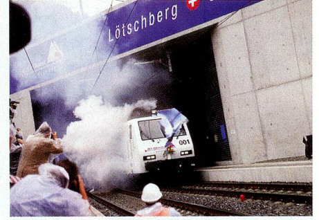
Obras de la NEAT en Mittholz (a la izquierda). Portal de las obras de Raron, junto al Ródano, en el cantón del Valais (en el centro). Ceremonia de apertura del 15 de junio de 2007, también en Raron (a la derecha).

El 15 de junio de 2007 se inauguró oficialmente el túnel de base del Lötschberg, pero solo se utilizará a pleno rendimiento a partir de diciembre, cuando entre en vigor el nuevo horario de circulación de trenes. Numerosas personalidades nacionales e internacionales asistieron a la inauguración. Entre ellas, el consejero federal Moritz Leuenberger. «Sin dejar de admirar por ello la gran proeza técnica y los extraordinarios rendimientos de todos los que han participado en la construcción del túnel de Lötschberg, lo cierto es que esta obra es mucho más que una grandiosa perforación en la montaña», dijo el ministro de transportes, quien añadió que es una prueba de «la consecuente realización de la política suiza de transporte de mercancías por vía férrea, que hoy sirve de modelo a toda Europa».