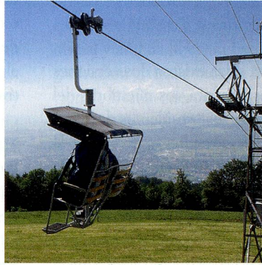
Teleférico de Weissenstein (SO)