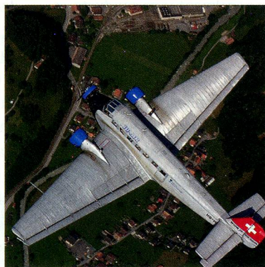
Aviones Junkers JU s2