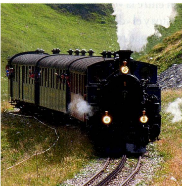
Ferrocarril a vapor de Furka (VS)