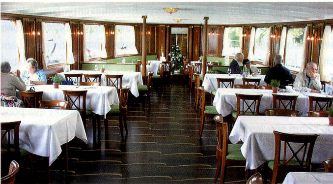
Barco de vapor en el lago de los Cuatro Cantones