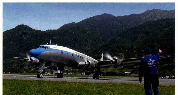
El avión Super Constellation