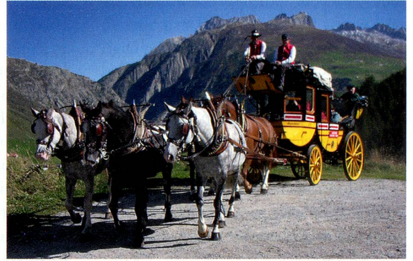
Diligencia del San Gotardo