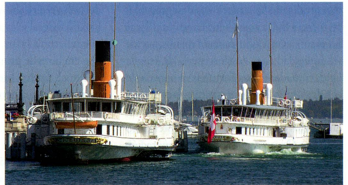
Flota de barcos de vapor del lago Lemán