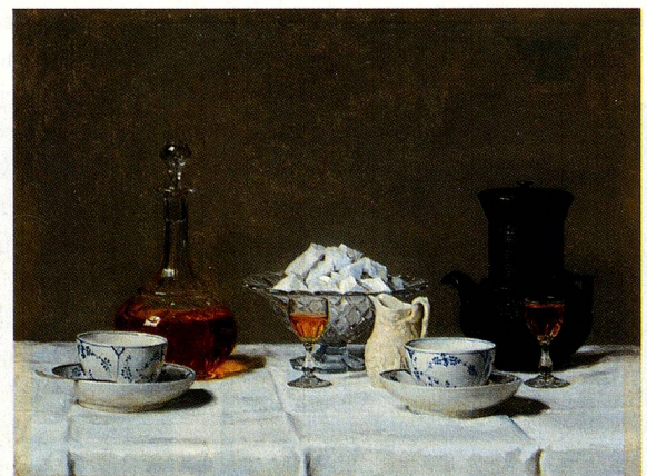
«Tee und Cognac». En sus bodegones, Albert Anker saluda a 200 años de distancia a su gran colega, Jean-Baptiste Siméon Chardin.