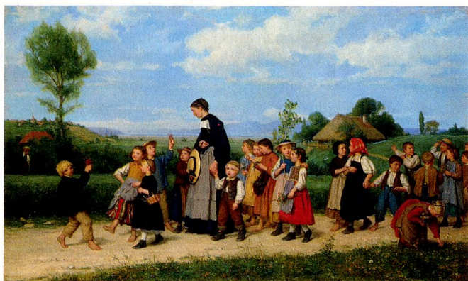
«Der Schulpaziergang». En 1872, Albert Anker, miembro del Consejo escolar, aboga por la obligatoriedad de la escuela mixta.