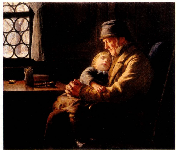
«Grossvater mit schlafender Enkelin». Los críticos dicen que Anker sólo pintaba viejos y niños. Y es que esos eran los modelos que tenían tiempo y no trabajaban en el campo.