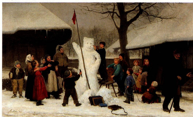
«Der Schneebär». El pintor conoce a «sus» berneses. No hacen un muñeco de nieve sino su animal heráldico, un oso de nieve.