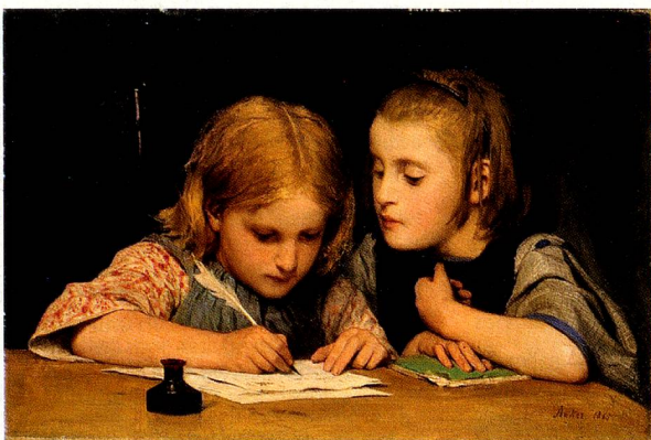
«Schreibunterricht II». No estamos en el paraíso, aprender a escribir es durísimo.