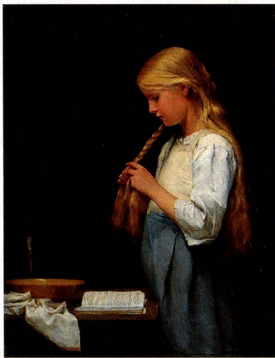
«Mädchen, die Haare flechtend». Anker dedica la misma atención a los libros, los paños y las trenzas: no se trata de un meticuloso realismo sino de una propensión a observar atentamente las diversas facetas de la vida.

Por eso es tan importante el éxito. Anker expone en el solicitado «Salón», mientras Manet, Degas y Monet son rechazados. Pasaba los inviernos en París, su cultura era muy amplia, abarcaba desde Platón hasta Darwin, y con sus amigos hablaba francés. En verano vivía y pintaba en la casa de sus abuelos en Ins, donde era muy popular y admirado. Sus cuadros de género son muy del gusto de la época. En el emergente Estado federal, Anker era como Calame y Koller, un enardecedor de la nación. La «sopa de los pobres» personifica la