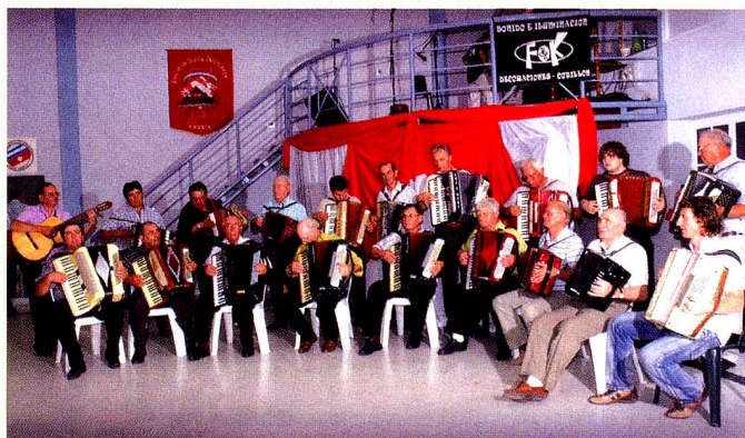
Acordeonistas que participaron