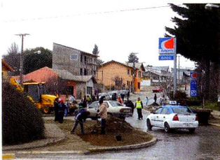
La solidaridad en marcha.

El informe finaliza: "De esta manera sentimos que estamos cumpliendo con lo que nos hemos propuesto y lo seguiremos haciendo con la colaboración de nuestros asociados".