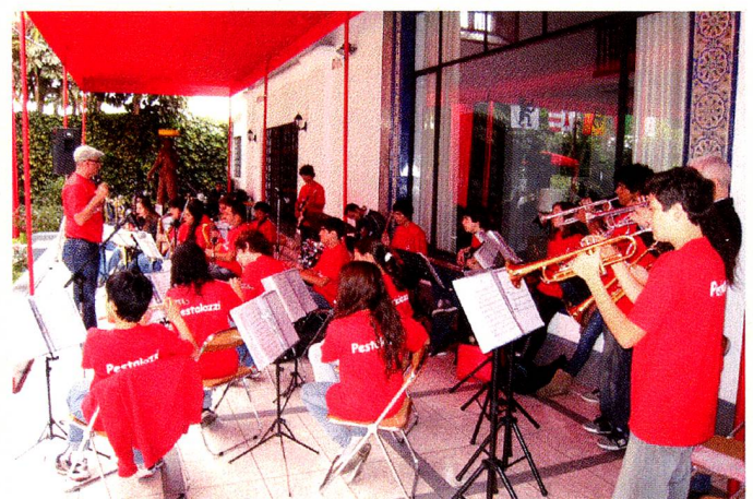
Orquesta del Colegio Pestalozzi