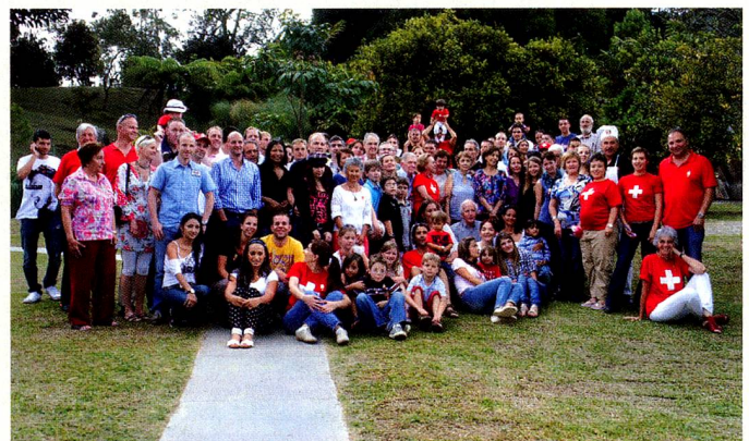
Foto del grupo durante el festejo en Colombia

La fiesta del 1º de agosto se celebró en Medellín con una nutrida asistencia. Más de un centenar de personas pasamos un día campestre y soleado degustando la típica comida suiza: ensalada de papas, ensalada de verduras, salchichas y postre. Varias familias aportaron su esfuerzo para la preparación de la comida y la atención del buffet y las bebidas, para que todo el grupo disfrute de esta ocasión