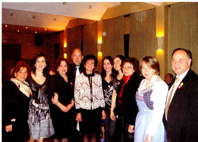
En el centro, la Sra. Embajadora, acompañada por algunos asistentes