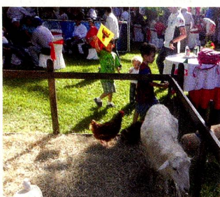
Granja de contacto

El ambiente musical respondió al sonido de los cornos con la cátedra de corno de la Escuela Mozarteum Caracas, recordando