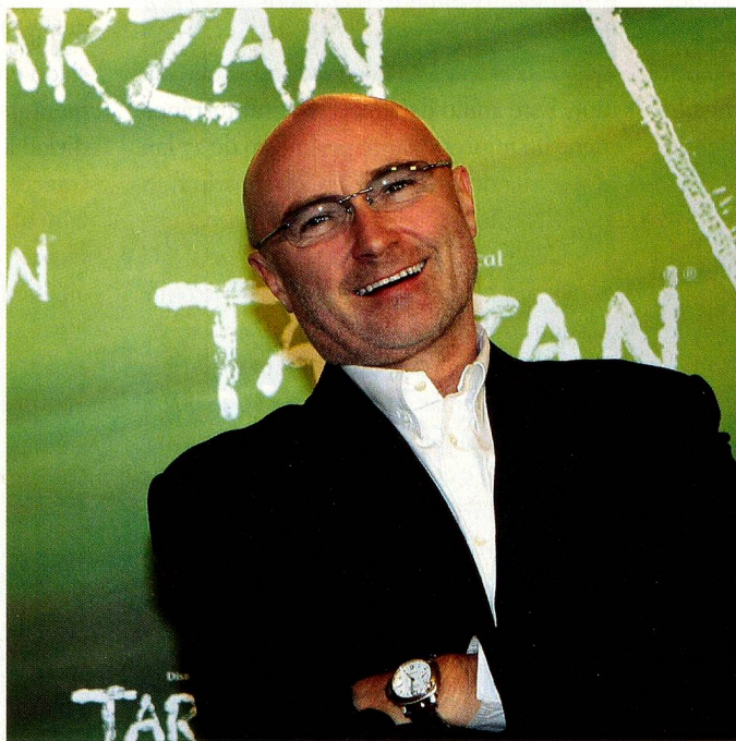
Suiza atrae también a muchos extranjeros ricos: la estrella del pop Phil Collins vive desde hace años cerca de Ginebra.

El nivel más elevado de integración es la adquisición de la ciudadanía, es decir la naturalización. Quien resida en Suiza desde hace doce años puede hacer una solicitud de naturalización. La Confederación aclara únicamente dos puntos – si el candidato cumple el ordenamiento jurídico y si supone un riesgo para la seguridad del país. El resto de los criterios es competencia de los cantones