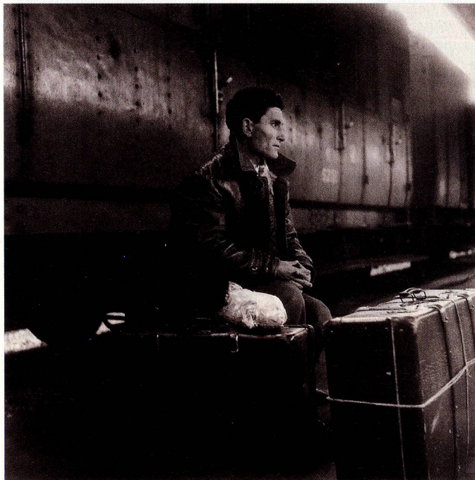
Joven obrero italiano llegado a Suiza a principios de los años 60.

Estas son las cifras principales relativas a la inmigración en Suiza: A finales de 2009 7,78 millones de personas vivían permanentemente en Suiza, de las cuales 1,71 millones o un 22% eran extranjeras. Esto suponía un total de 84.000 personas o un 1,1 % más que el año precedente (en 2008 se contabilizó in-