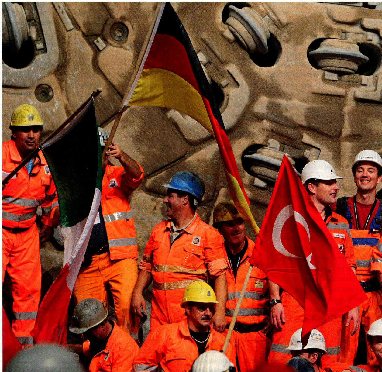
Júbilo tras la perforación final del túnel de base del Gotardo el pasado octubre.

En abril de 2011, los mineros de la parte norte y los de la parte sur deberían poder darse la mano también en la zona donde está situado el tubo del oeste. En los tramos del túnel ya abiertos, ha comenzado el montaje de los carriles y los sistemas técnicos del ferrocarril. Lo más tardar en 2017 circularán rápidamente por el túnel los primeros trenes de pasajeros y de mercancías, diseñados para que se alcance una velocidad máxima de 250 km por hora. No obstante, la línea del