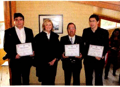
Homenaje a los fotógrafos locales

nuestros antepasados, como el sentido de la responsabilidad que ha sido el legado más importante que ha influido en mi vida"; manifestó el artista visual.