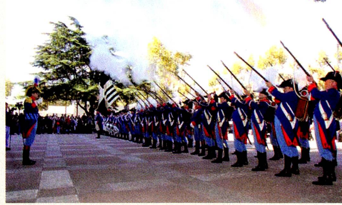
Salva de honor frente a la Intendencia de Colonia

Por otra parte, la colaboración del Cantón de Friburgo y la Embajada de Suiza con el Municipio de Nueva Helvecia permitirá la construcción de un policlínico barrial en el Barrio Retiro.