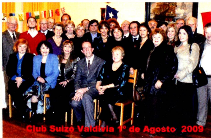
Club Suizo Valdivia 1º de Agosto 2009

"Esta muestra viene a rescatar la herencia de los valores de