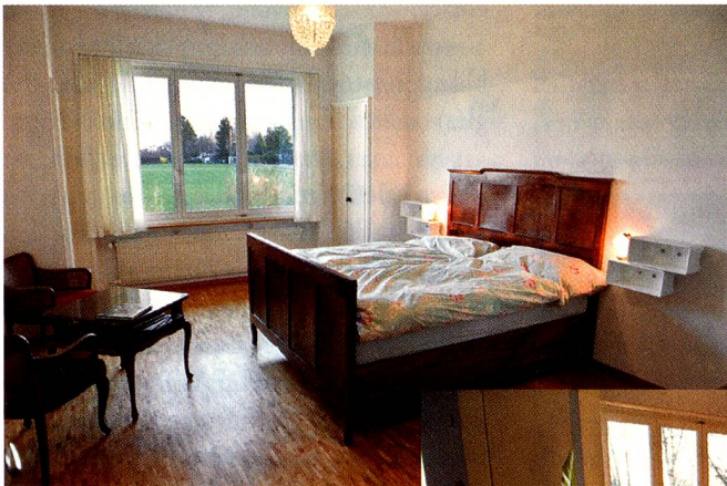
Im Klee, Bed & Breakfast, Melchenbühlweg 8, 3013 Berna +41 31 931 35 35 www.imklee.ch, schlafen@imklee.ch

sur, ofrecen una fantástica vista del panorama alpino, cuestan entre 75 y 130 francos por noche (individuales, respectivamente dobles, en caso de estancias más prolongadas hay descuentos). Dos habitaciones tienen agua corriente, las duchas y los servicios se encuentran en el mismo piso. Hay aparcamientos delante de la casa y los transportes públicos y el famoso restaurante «Schöngrün» están a muy poca distancia. BE